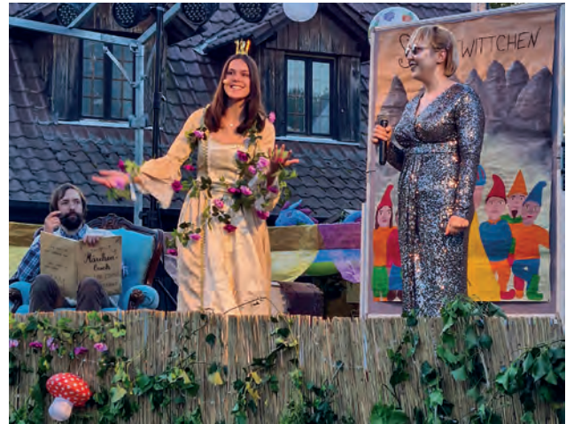
Märchen mal anders: Dornröschen nimmt ihr Leben endlich selbst in die Hand.

Auf diesem Weg trafen wir auf viele weitere Märchenfiguren, die es leid waren, vorgegebenen Rollen entsprechen zu müssen. So hatte beispielsweise der Spiegel der bösen Königin keine Lust mehr auf Oberflächlichkeiten. Der Wolf aus Rotkäppchen hatte es buchstäblich satt, immer der Böse zu sein und die arme Oma zu fressen. Er fand im Wunderland eine friedliche Zukunft. Doch so einfach, wie es klingt, war es nicht. Denn die Herzkönigin fühlte sich von dem hübschen Dornröschen angegriffen, die nur knapp und durch die Hilfe der Teilnehmenden überlebte. Diese mussten im Schutze ihrer Jugend, denn Kindern tut die Herzkönigin nichts, zahlreiche komplexe und sportliche Aufga-