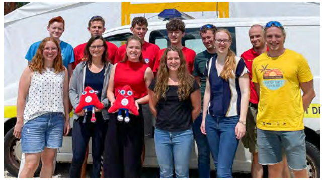
Das zwölfköpfige Team der Wasserretter beim Trainings- und Vorbereitungscamp in Orleans.

Der Einsatz bei den Olympischen Spielen war für die vier Hessen ein besonderes Erlebnis. Dass sie nach dem mehrstufigen Auswahlverfahren als Wasserretter ihre Akkreditierung erhielten, macht sie stolz. <